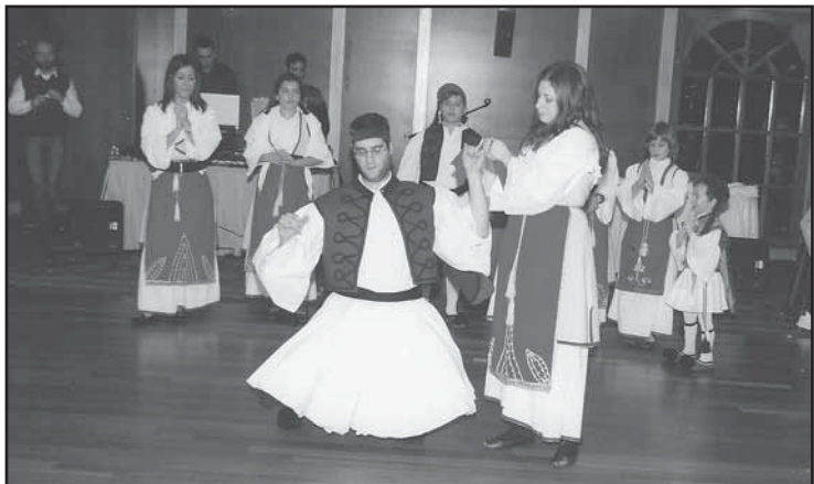
Το χορευτικό του Συλλόγου μας σε πλήρη δράση.