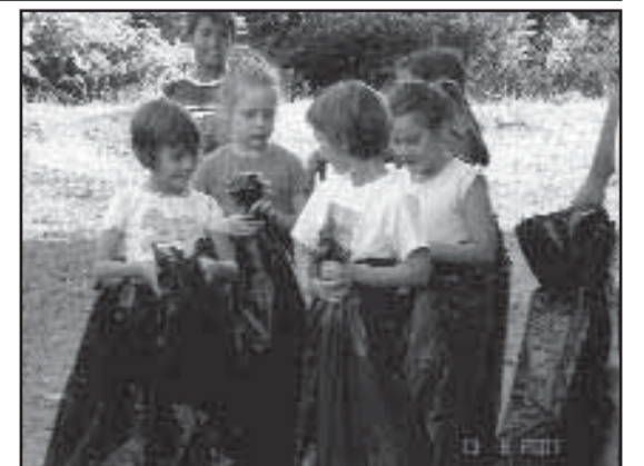
Τα παιδιά που συμμετείχαν στους αγώνες της 14ης Αυγούστου 2007 στην Κερασία