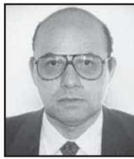
Ο Δήμαρχος Βαρδουσίων