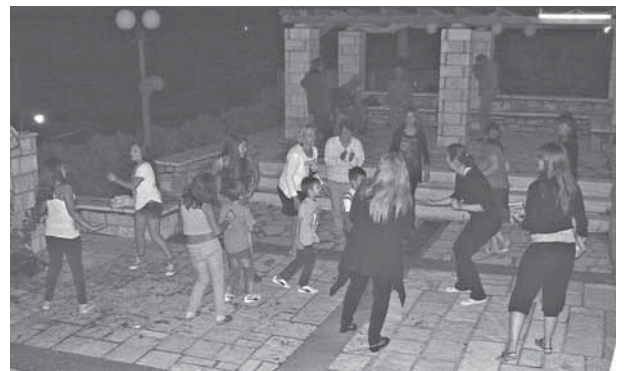
17/8/12 Πάρτυ της νεολαίας στην κάτω πλατεία