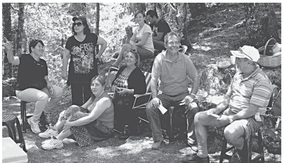
24/8/12 Πικ-νικ στην Μπούκουρη Επίσης, στις 22/8/12 έγινε πεζοπορία στον προφήτη Ηλία Τριστένου