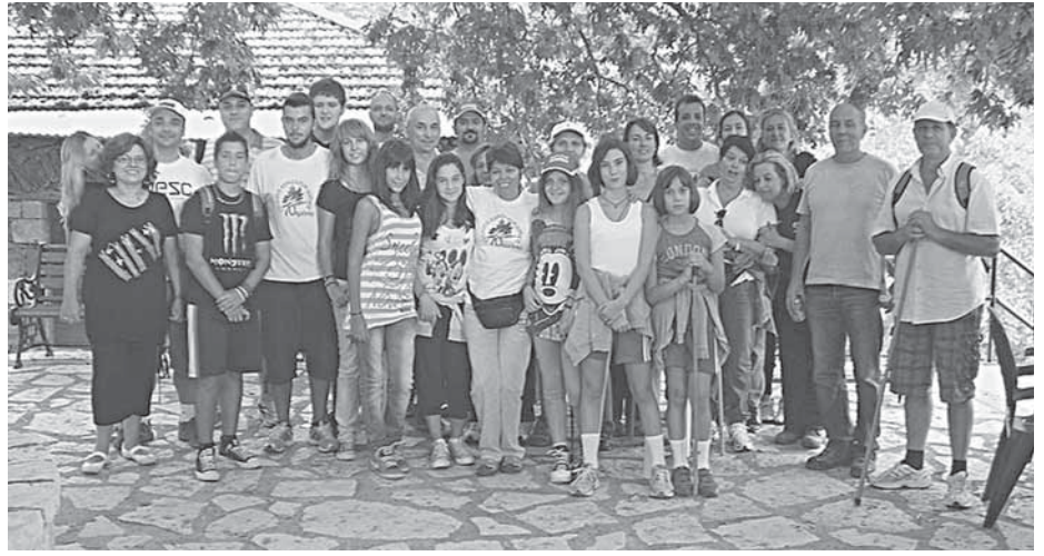
16/8/12 Πεζοπορία για καφέ στο Κριάτσι από τον δασικό δρόμο