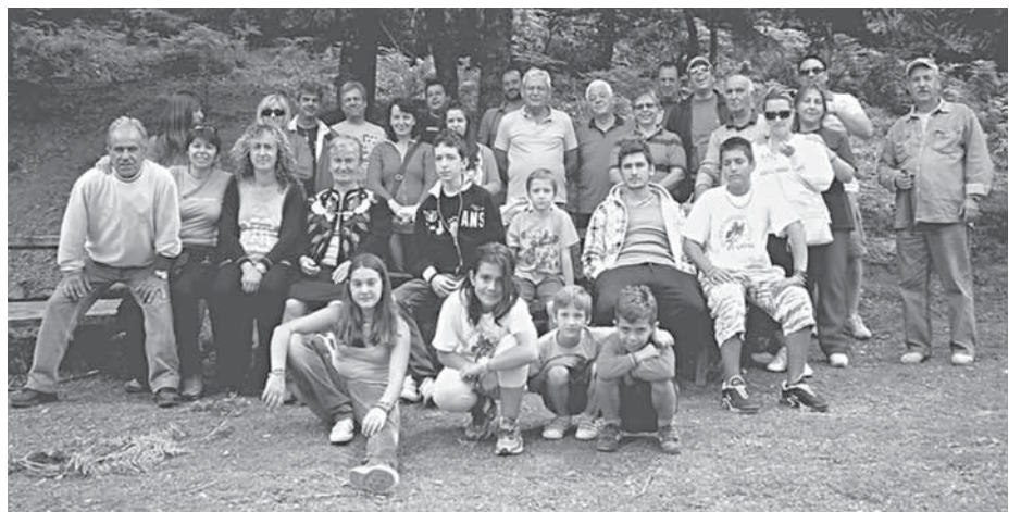
19/8/12 Εκδρομή στην Γραμμένη Οξιά