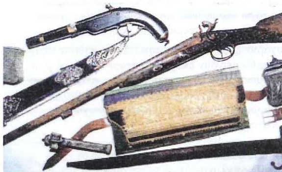
Όπλα και παλάσκα από την επανάσταση του 1821.