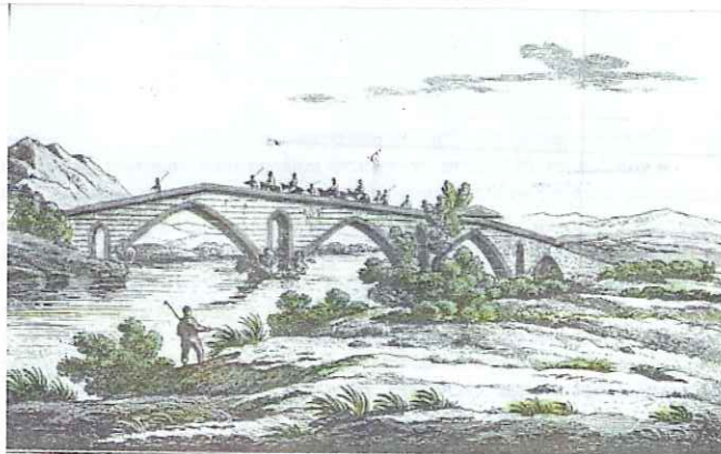
Η γέφυρα της Αλαμάνας (Romardi 1820) (Από το βιβλίο: Δημ. Λουκόπουλος, ΑΡΤΟΤΙΝΑ, 1995, σ. 13).

Αντώνης Σούκος (Από την Πενταγιού-Δωρίδος)